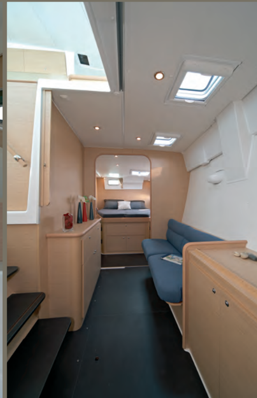
Coque propriétaire bâbord : cabine, sofa, salle de bain / Owner's portside hull: cabin, sofa, head and shower.