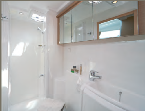
Salle de bain arrière tribord / Aft starboard head and shower.