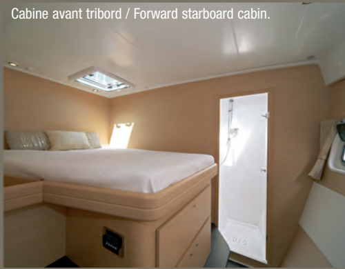
Cabine avant tribord / Forward starboard cabin.