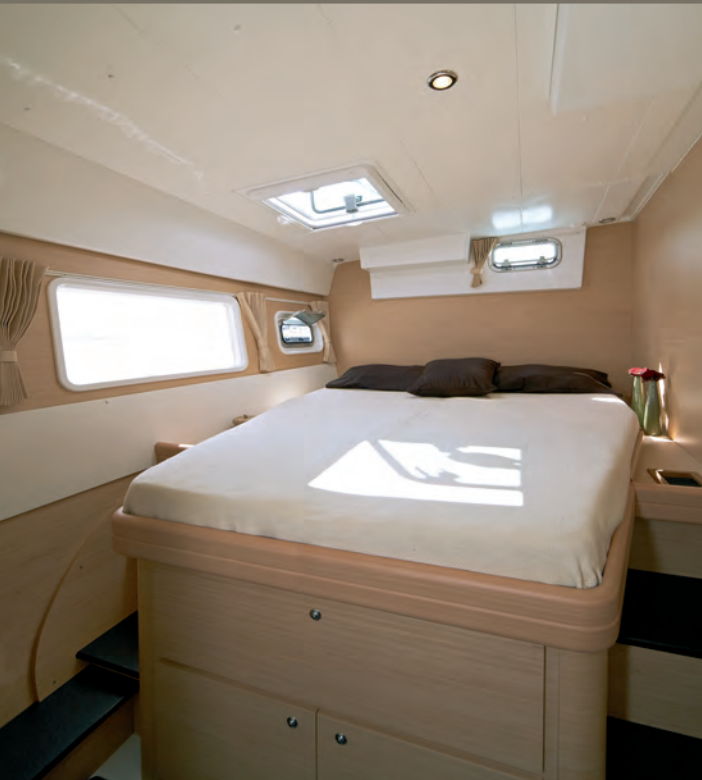
Cabine arrière tribord / Aft starboard cabin.