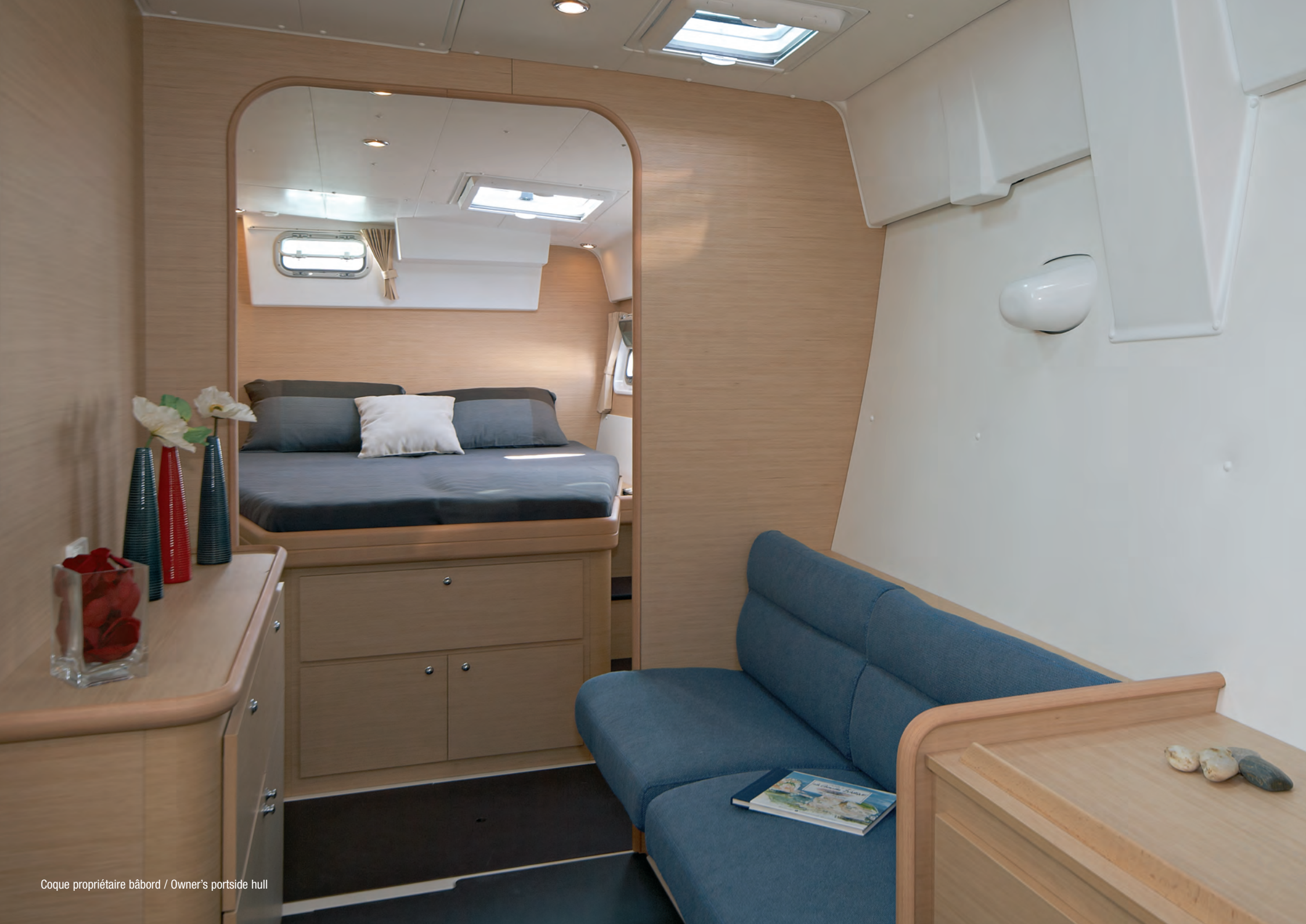
Coque propriétaire bâbord / Owner's portside hull